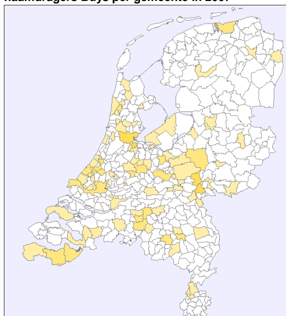
naamdragers Buys per gemeente in 2007